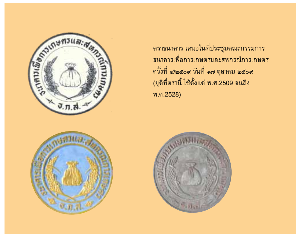
ตราธนาคาร เสนอในที่ประชุมคณะกรรมการธนาคารเพื่อการเกษตรและสหกรณ์การเกษตร ครั้งที่ ๔/๒๕๐๙ วันที่ ๑๗ ตุลาคม ๒๕๐๙ (ยุดิตที่ตรานี้ ใช้ตั้งแต่ พ.ศ.2509 จนถึง พ.ศ.2528)

ต่อมาในการประชุมคณะกรรมการ ธ.ก.ส. ครั้งที่ ๔/๒๕๐๙ วันที่ ๑๗ ตุลาคม พ.ศ. ๒๕๐๙ คณะกรรมการมีมติให้กำหนดตราของธนาคารเป็นรูปวงกลมระหว่างขอบวงนอกและขอบวงใน มีชื่อ “ธนาคารเพื่อการเกษตรและสหกรณ์การเกษตร” ตอนล่างมีอักษรย่อชื่อของธนาคาร “ธ.ก.ส.” ภายในขอบวงในมีรูปถุงเงินและรวงข้าว ซึ่งหมายถึงการให้เงินกู้เพื่อการผลิตทางการเกษตรและการเงิน