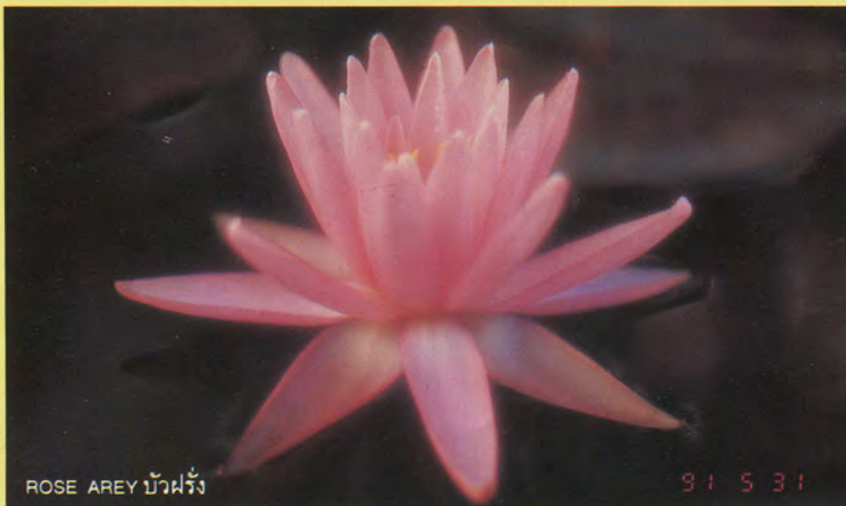
ROSE AREY บัวฝรั่ง