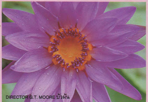
DIRECTOR G.T. MOORE บัวผัน