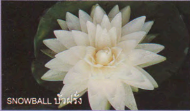
SNOWBALL บัวฝรั่ง