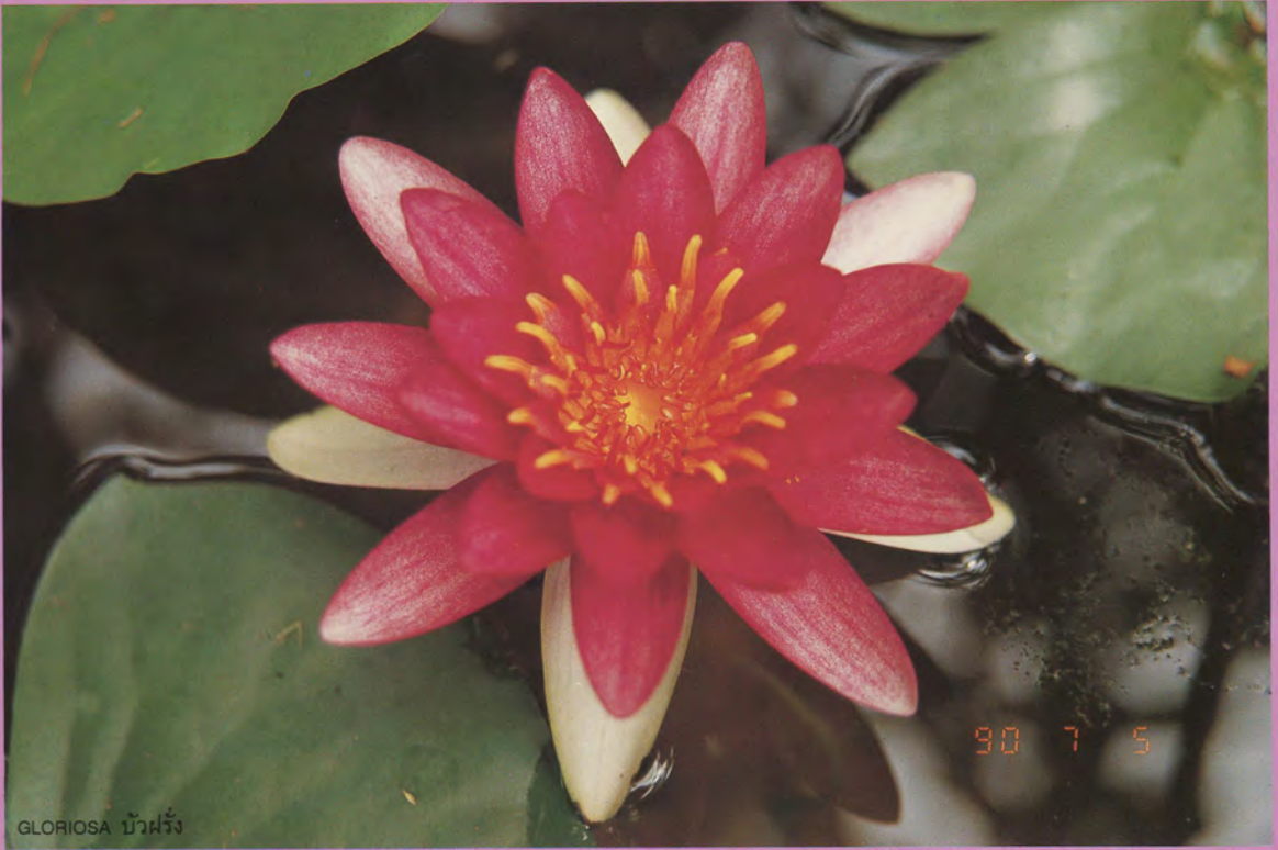
GLORIOSA บัวฝรั่ง