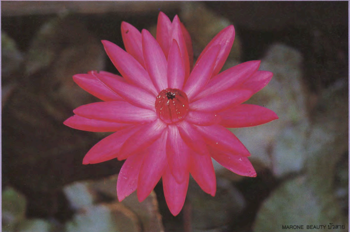
MARONE BEAUTY บัวสาย