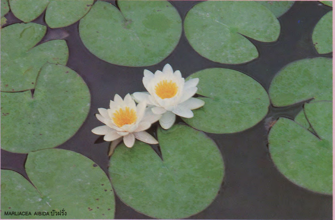
MARLIACEA AIBIDA บัวฝรั่ง

นักพฤกษศาสตร์ได้จัดสกุลา (genus) ของไม้น้ำที่คนไทยเรียกว่าบัว 3 สกุล อันได้แก่