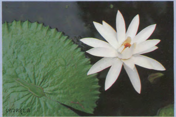
เศวตอุบล

มีชื่อสามัญภาษาอังกฤษว่า 'Lotus' คนไทยโบราณนอกจากจะใช้คำว่าบัวหลวงแล้ว มักจะนิยมใช้ชื่อภาษาสันสกฤตว่า ปทุม หรือ ปทุมชาติ (วรรณคดีไทยสมัยเก่า ๆ แทบจะไม่ได้ใช้คำว่าหลวงเลย) พรรณ (Species) และพันธุ์ (Variety) ดั้งเดิมของบัวหลวงมีเพียง 3 กลุ่ม คือ กลุ่มสีเหลืองอ่อน (หายากมาก) กลุ่มสีชมพู และสีขาว ปัจจุบันมีผู้พยายามผสม ปรับปรุงพันธุ์จนได้สีเหลืองค่อนข้างเข้มแดงเข้มแสด ฯลฯ บัวพวกนี้ขยายพันธุ์โดยเมล็ด เจริญเติบโตเป็นไหล (Stolon) ได้และขนานกับผิวดิน แล้วแตกต้นใหม่จากไหลซึ่งนำไปขยายพันธุ์ต่อได้