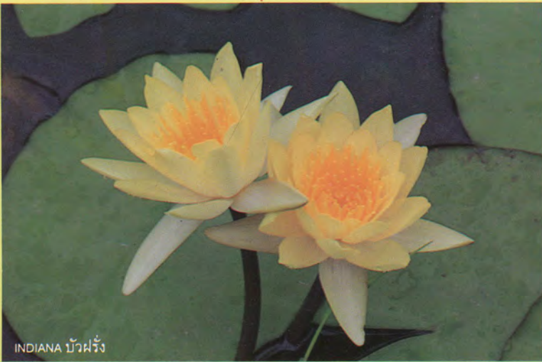
INDIANA บัวฝรั่ง