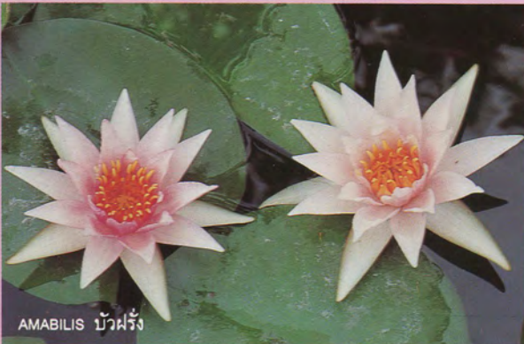
AMABILIS บัวฝรั่ง

ไว้ในวงศ์ Nymphaeaceae เดียวกัน มีรากศัพท์ภาษาอังกฤษจากคำว่า 'Nymph' ซึ่งแปลว่า 'สาวน้อย' หรือ 'แม่เทพธิดาที่อยู่ในน้ำ'