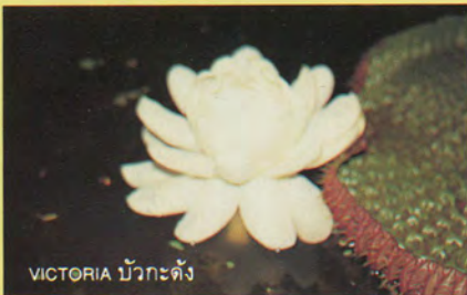
VICTORIA บัวกะตัง