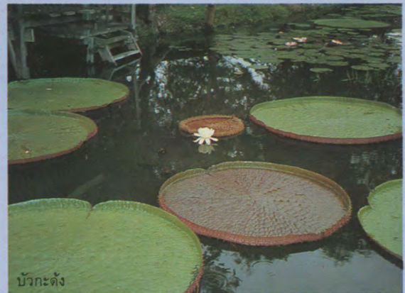
บัวกะดิง