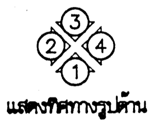
แสดงทิศทางรูปด้าน