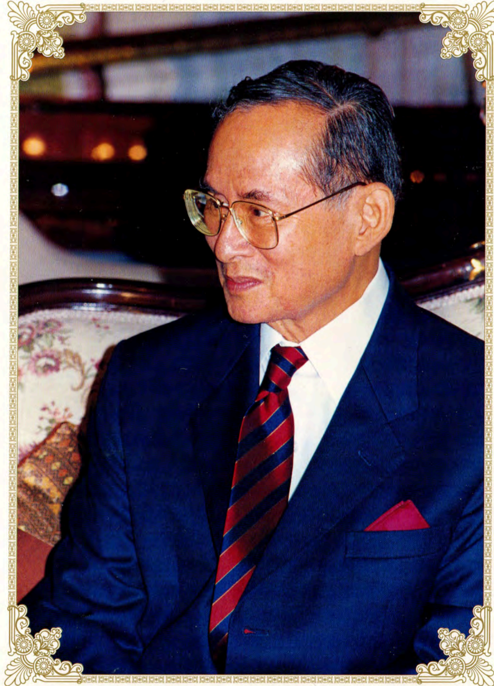
พระบาทสมเด็จพระเจ้าอยู่หัวภูมิพลอดุลยเดช His Majesty King Bhumibol Adulyadej