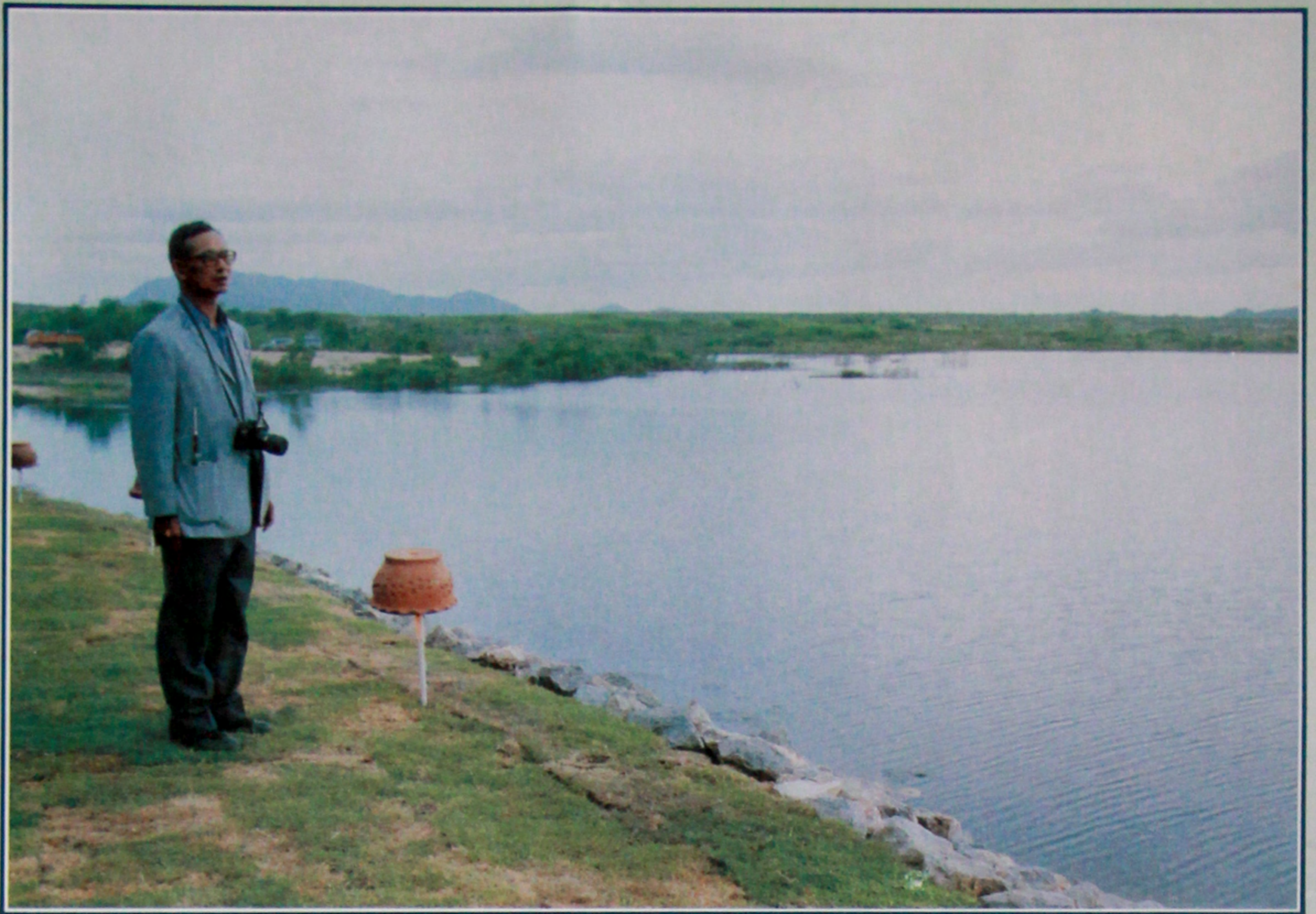
ภาพพระราชทาน