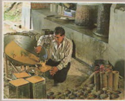
น้ำตาลมะพร้าว

เมื่อได้รับผลผลิตสูง เกษตรกรก็น่า จะมีรายได้สูงตามไปด้วย แต่ในสภาพความ เป็นจริงมิได้เป็นเช่นนั้นเสมอไป เนื่องจาก กลไกของตลาดและปัจจัยอื่นๆ ในระบบ เศรษฐกิจต่างก็มีอิทธิพลต่อการซื้อขายผล ผลิตทางการเกษตรแทบทั้งสิ้น