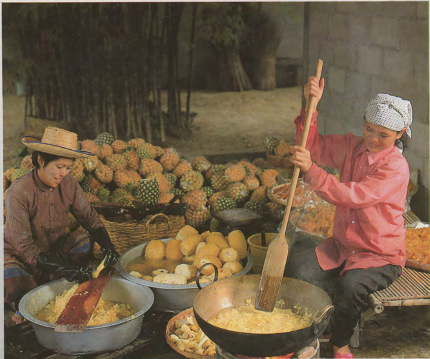
สับประรดกวนไว้ อร่อยได้นานวัน