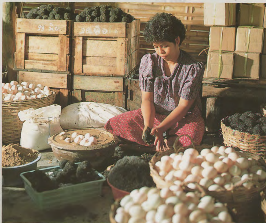
ไข่เค็มชั้นซ้อ คือไข่ "โซยา"