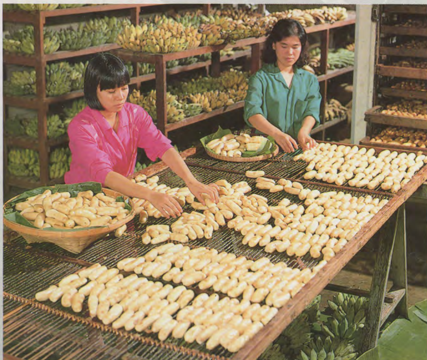
กล้วยอบบิ๋มหวาน เป็นพื้งค้ำจั้นรชชาติ