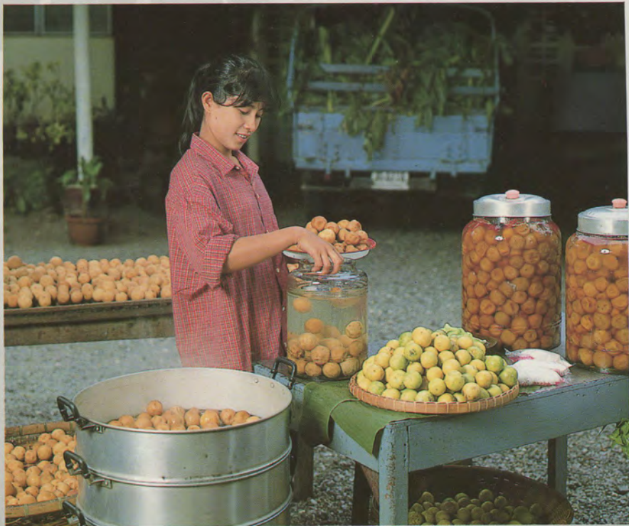
มะนาวคองของดี ทวีรสอาหาร