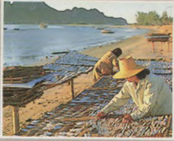
ปลาตากแห้ง