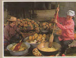
สับปะรดกวน