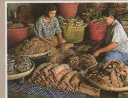
หัวผักกาดดอง