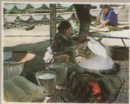
หมี่โคราช