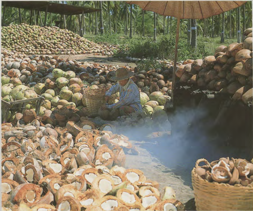
มะพร้าวแห้ง "ทับสะแก" ก่อนแปรเป็นน้ำมัน