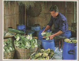
ผักกาดเขียวปลีตอง