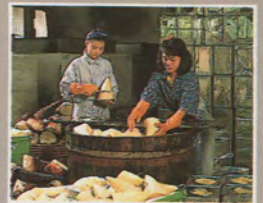
หน่อไม้ไฟตง