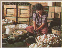
ไชเค็มพอก

อานวย นามะ เป็น ขอแบบสร้างสรรค์ ชนงคณาฎ เจ็จจินอ็ด ผู้ร้อวมละประตาดานงานอ่ามภาพ ทฤษฎี ประกอบชาติ, จิทธิพล มิถุล นันท์ทิกภาพ