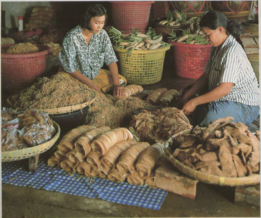
หัวผักกาดเค็ม...หวาน เก็บนานชวนชิม