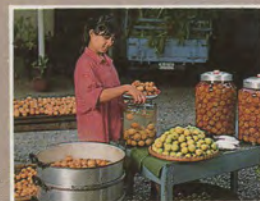
มะนาวดอง