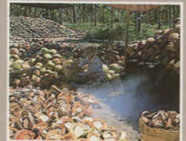
มะพร้าวตากแห้ง