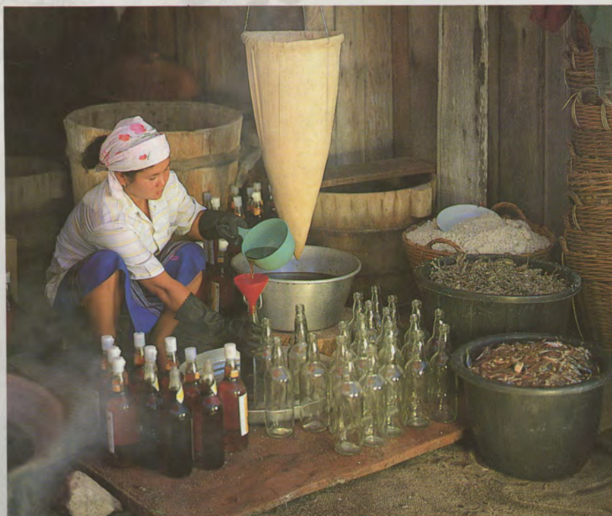
ปลาเล็กรวมได้ หมักไว้ทำน้ำปลา