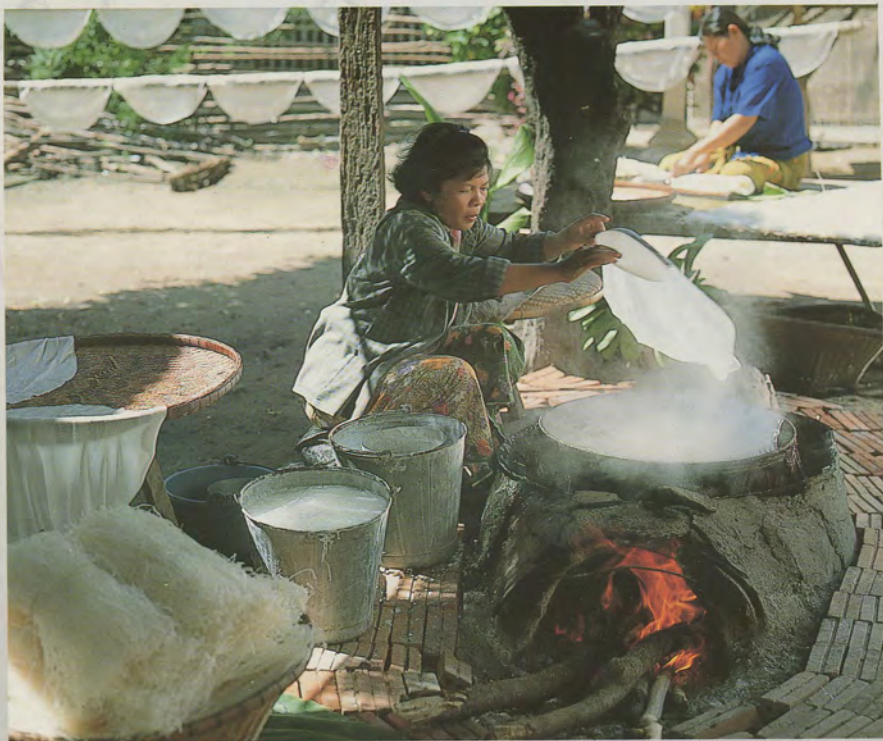
แปรงแก้งข้าวเจ้า เป็นหมี่ขาว "โคราช"