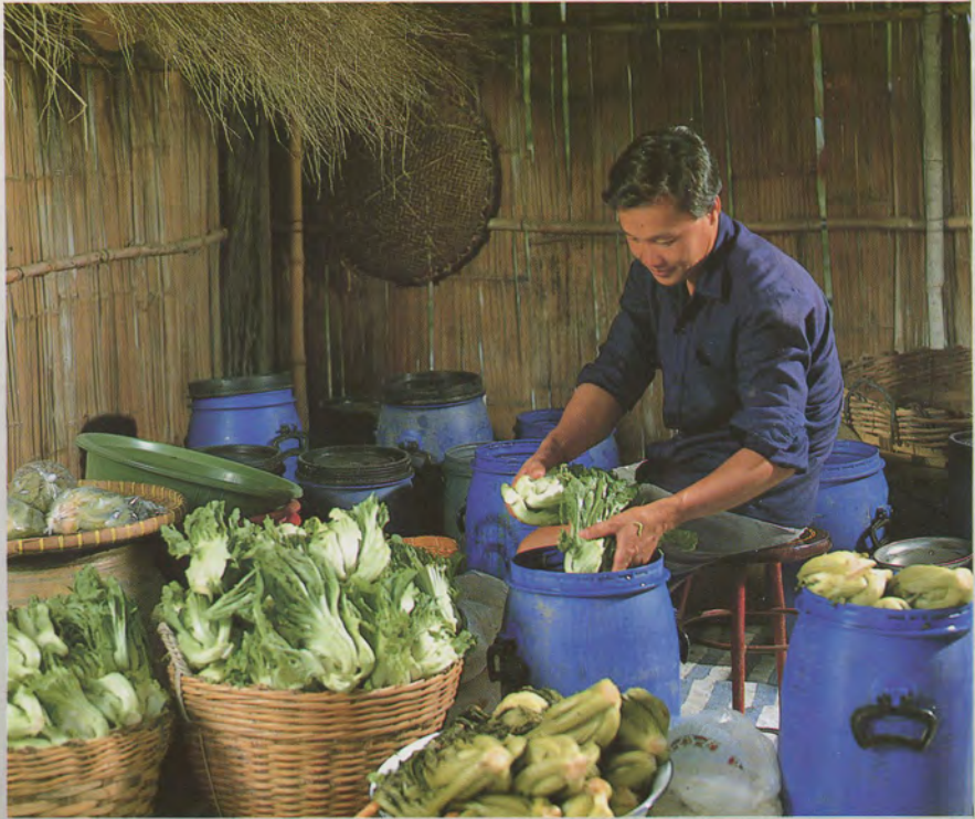
ผักสดเสียได้ ต้องรีบขนาน