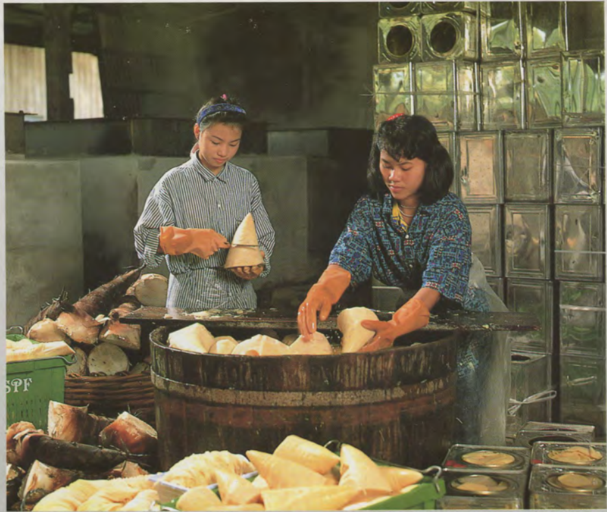
บรรจู่ไวชาย หน่อไม้ไผ่ตง