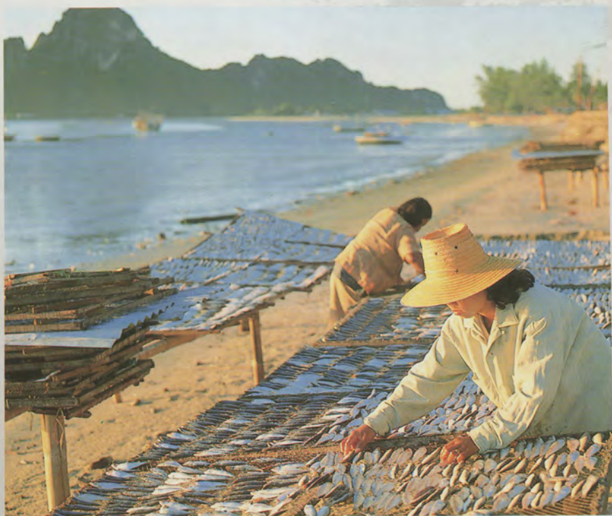
แดดจ้าทำให้ เร็วไว้รับตากปลา