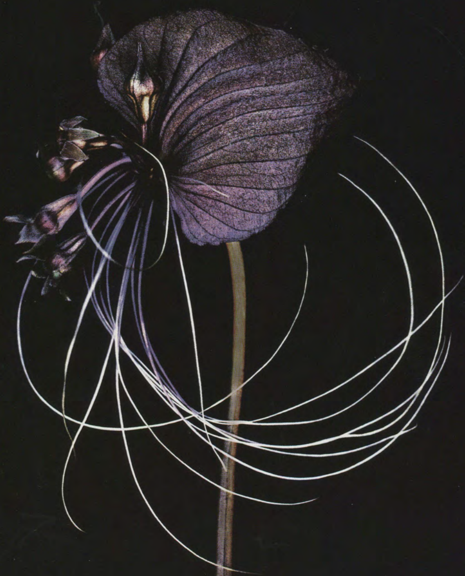
ค้างคาวดำ